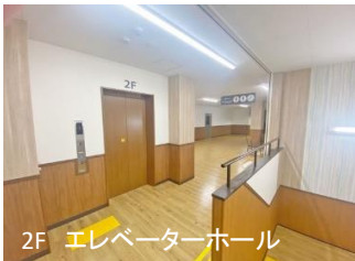
2F エレベーターホール