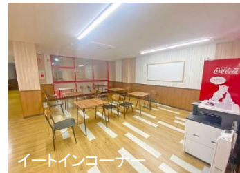
イートインコーナー