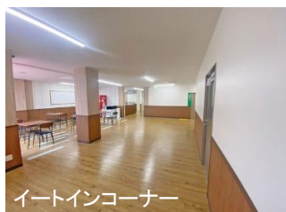
イートインコーナー