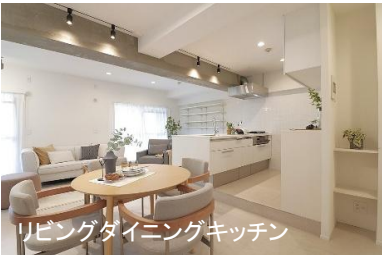
リビングダイニングキッチン