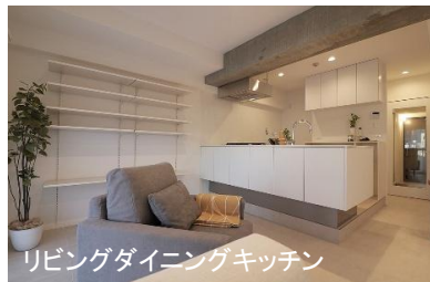
リビングダイニングキッチン